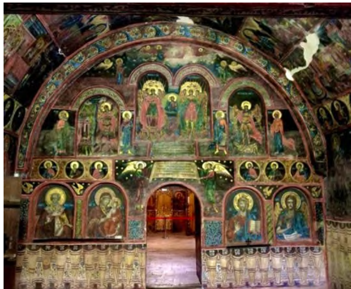
Ил. 3 Църква „Св. Архангели Михаил и Гавраил“

Втората спирка от нашият културен пешеходен маршрут е църквата „Рождество Христово“, която се намира в изключителна близост до първият обект. Един от най-посещаваните обекти на музея – с близо 3 500 туристически посещения по данни на музея за изминалата 2020 година, когато въпреки кризата с COVID-19, ограничителните мерки и затварянето на музеите на два пъти, интересът към