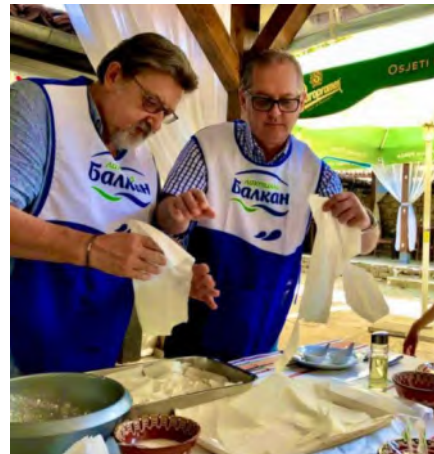
Ил. 9 Инициативи, с участие на туристи