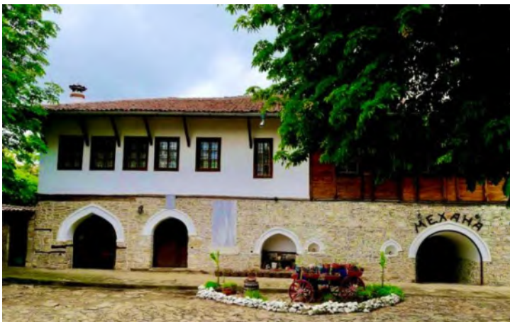
Ил. 8 Етнографски комплекс „Българка“

Нашият маршрут завършва в етнографски комплекс „Българка“. Основите на комплекса са положени преди повече от 300 години, като голяма част от тях са съхранени, за да може всеки от посетителите да се докосне до истинския български дух и бит. Комплексът предлага разнообразни туристически продукти свързани с българските традиции и обичаи. Като например заквасване на прясното мляко и превръщането му в кисело, приготвяне на баницата по традиционна рецепта. Като при тези демонстрации, туристите имат възможността да се включат при желание от тяхна страна. Освен това имат и богата фолклорна програма – възстановка на сватба, музикални изпълнения от различни фолклорни области, с което съхраняват духът на миналото и се вписват много добре в общия облик на Арбанаси.