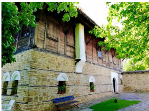
Ил. 6 Музей „Констанцалиевата къща“, екстериор

Констанцалиевата къща се намира в централната част на Арбанаси, в близост до известната Коконска чешма. Чешмата носи името на една от обитателките на „Констанцалиевата къща“ Кокона Султана. Къщата е двуетажна, построена на линията на улицата накъдето е обърната изцяло каменната ѝ фасада, без еркери на подавания. Солидни каменни зидове ограждат дворното ѝ пространство. Има висока, масивно изградена каменна порта, през която са влизали тежките кервани със стоки, закупени от собственика на дома. От северната страна на къщата има друга, по-малка еднокрила врата предназначена за пешеходци. Но цялото оформление създава впечатление за бойна кула, изключително добре укрепена.