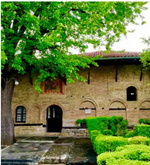
Ил. 2 Изглед към църква „Св. Архангели Михаил и Гавраил“

Първата църква, с която започва предложението от нас туристически пешеходен маршрут е „Св. Архангели Михаил и Гавраил“. Църквата се намира в южния край на селото, откъдето започва нашия маршрут. При влизането в двора се забелязват стените украсени с плитки аркирани ниши. Вътре има много добре запазени стенописи, които разкриват връзките с традициите на Търновската живописна школа, показващи ни сцени от Стария и Новия завет. Иконостасът в църквата е дело на резбари от Тревненската школа, горял и подновен в дясната си част през 1834 г. Църквата музей има уникална акустика и не е учудващо, че именно тук се провежда Фестивал на класическата камерна музика в Арбанаси. „Arbanassi Summer Music“ се провежда за 10-а година и е едно от най-специалните музикални събития в Източна Европа. За това допринася богатата фестивална програма, големи изпълнители на класическа музика и, разбира се, спиращата дъха обстановка на Арбанаси.