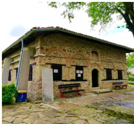
Ил. 5 Църква „Рождество Христово“