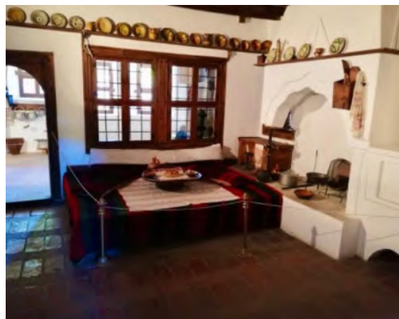
Ил. 7 Музей „Констанцалиевата къща“, интериор