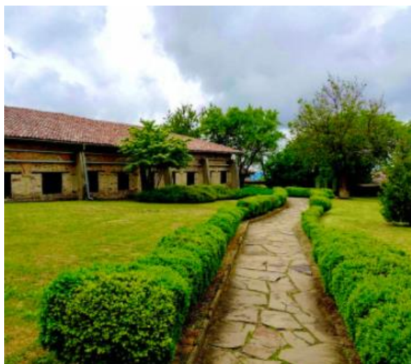
Ил. 4 Църква „Рождество Христово“

Църквата „Рождество Христово“ е преизградена многократно и е преминала през няколко строителни етапа. Самата църква представлява масивно изградена каменна постройка, изпълнена с много красиви стенописи, разположени на обща площ – стени, сводове и тавани – от 2000 кв. м. Изаграфисването е станало поетапно, а персонажите в тези стенописи са хиляди. Няма да ни стигне времето, за да ги изброим всички. Просто трябва да се видят! Но като акцент в галерията се откроява най-старата сцена регистрирана на територията на България. Става въпрос за стенописът Колелото на живота или „Суетния живот в лъжовния свят“, който е вече на близо 400 години. 7 Колелото на живота е създадено през XVII в. и като концепция представлява идеята за преходността на човешкия живот. Но това в Арбанаси е още по-сложно, тъй като в един своеобразен слънчев диск са вплетени сезоните, зодиакалните знаци и дванадесетте месеца. Говори се, че самия Захари Зограф се е вдъхновил от него, преди да създаде своя шедевър на Колело на живота в Преображенския манастир.